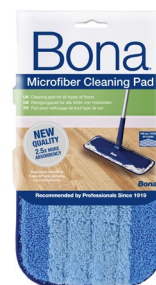
Pad de Nettoyage