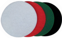
Accessoires : Patins pour tous types de sols disponibles avec différents degrés de dureté.