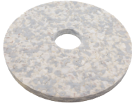
Duo Pad. N° article 201077