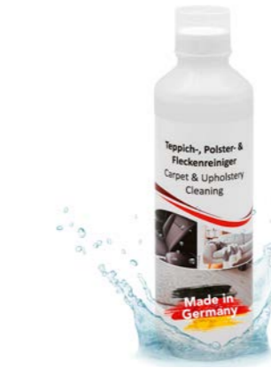
Nettoyant pour tapis, tissus d'ameublement et taches N° article 121122