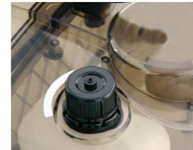
Un réservoir séparé permet l'utilisation d'un produit anti-moussant et garantit ainsi un travail aisé.