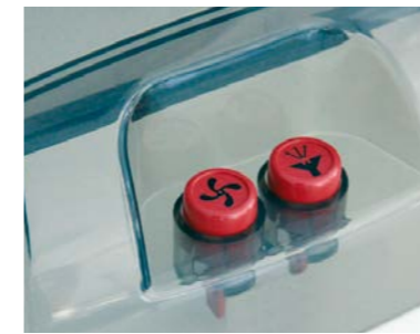
Boutons de sélection distincts sur l'appareil pour choisir entre fonction d'aspiration et de pulvérisation.

..... Embout à coussin pour le nettoyage de sièges auto par ex. La fonction de vaporisation est réglable à l'aide de la poignée de commande.