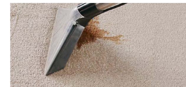
Embout de pulvérisation transparent pour sols avec long tube d'aspiration pour le nettoyage confortable des tapis et moquettes.