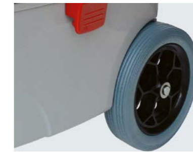
Grandes roues caoutchoutées pour un travail sans traces, même sur des sols sensibles.