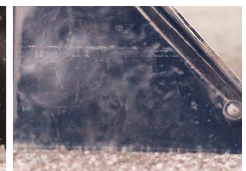
Ensuite, la saleté est aspirée, avec le liquide.