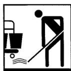
Produit pour le nettoyage manuel des sols