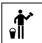
Produit pour le nettoyage des murs et surfaces